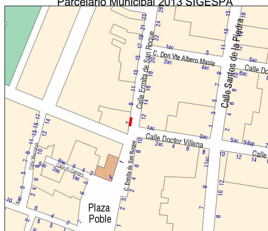
Planeamiento vigente SIGESPA