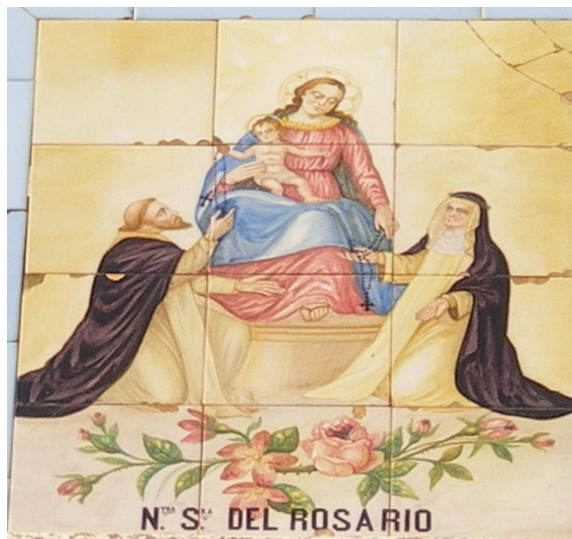
Retablo cerámico de Nuestra Señora del Rosario