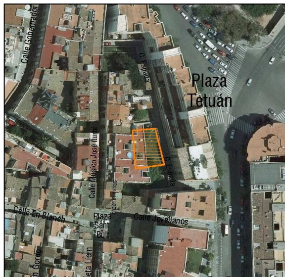
Foto aérea 2008 SIGESPA con ámbito arqueológico propuesto o refugio