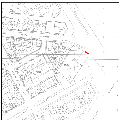
Cartográfico C.G.C.C.T 1980