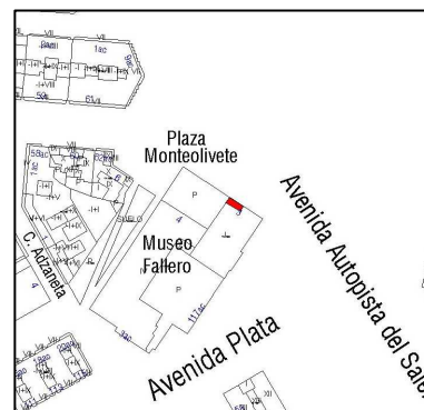
Parcelario Municipal 2009 SIGESPA

NUMERO DE EDIFICIOS: 1 NUMERO DE PLANTAS: OCUPACION: CONSERVACION: Bueno,