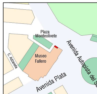
Planeamiento vigente SIGESPA

PLANEAMIENTO: PGOU (BOE 14/01/1989) HOJA PLAN GENERAL: 41 CLASE DE SUELO: SU CALIFICACION: USO: SIN USO PROTECCION ANTERIOR: OTROS: Corrección de Errores: DOGV 03.05.1993