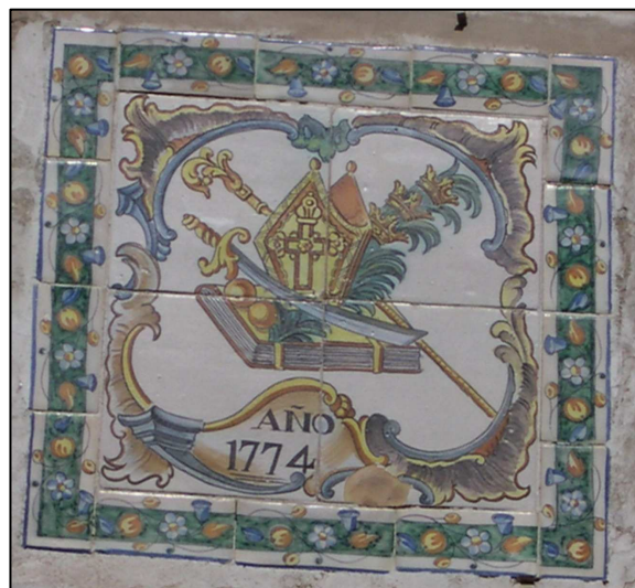
Retablo cerámico con los Atributos de San Nicolás de Bari

REF. CATASTRAL VIGENTE: Cartografía Catastral: YJ2753B Manzana: 55317 Parcela: 08 CART. CATASTRAL IMPLANTACION: 401-16-II FORMA: SUPERFICIE: