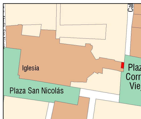
Planeamiento vigente SIGESPA

PLANEAMIENTO: PEPRI MERCAT [BOP 19-05-93 HOJA PLAN GENERAL: 34 CLASE DE SUELO: SU CALIFICACION: USO: SIN USO PROTECCION ANTERIOR: OTROS: Nº Archivo: R11278