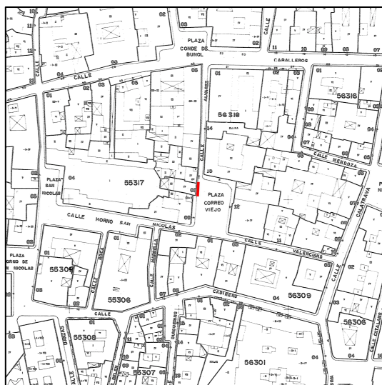
Cartográfico C.G.C.C. 1980