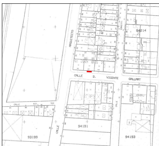
Cartográfico C.G.C.C.T 1980