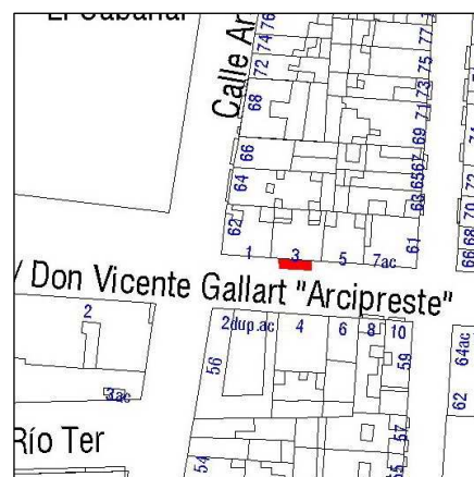
Parcelario Municipal 2012 SIGESPA

NUMERO DE EDIFICIOS: 1 NUMERO DE PLANTAS: OCUPACION: CONSERVACION: Bueno, integro. El riesgo de destrucción es escaso