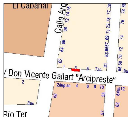
Planeamiento vigente SIGESPA

PLANEAMIENTO: PGOU (BOE 14/01/1989) HOJA PLAN GENERAL: 36 CLASE DE SUELO: SU CALIFICACION: USO: SIN USO PROTECCION ANTERIOR: OTROS: Corrección de Errores: DOGV 03.05.1993