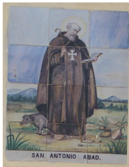
Retablo cerámico de San Antonio Abad

REF. CATASTRAL VIGENTE: Cartografía Catastral: YJ2792A Manzana: 94219 Parcela: 45 CART. CATASTRAL: 423-5-III IMPLANTACION: FORMA: SUPERFICIE: