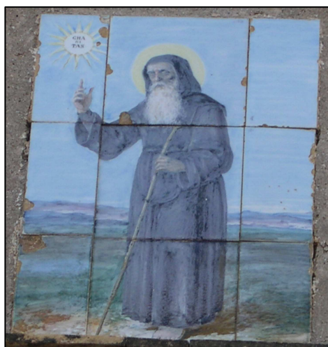
Retablo cerámico de San Francisco de Asís