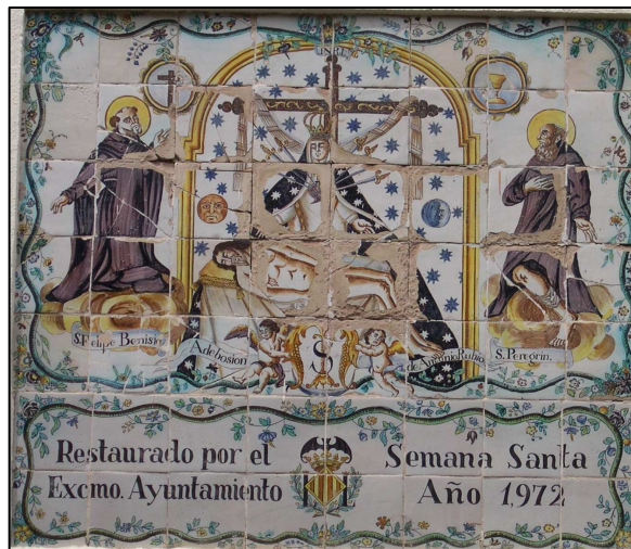
Retablo cerámico de la Virgen de los Dolores Con Felipe Benisio y San Peregrin