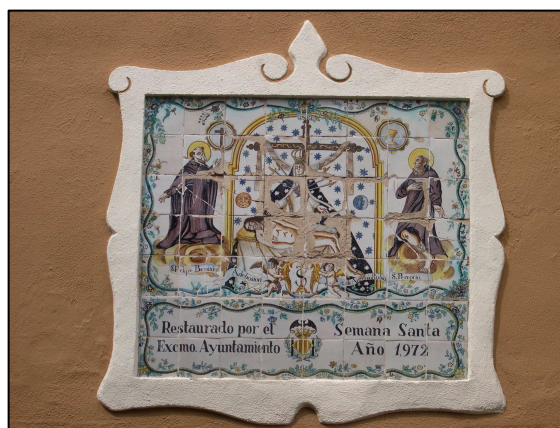
Panel en la fachada de la Iglesia Nuestra Señora de los Angeles