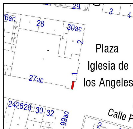
Parcelario Municipal 2009 SIGESPA

Rotas las piezas nº 10, 18, 20, 21, 31, 32, 35. Falta esmalte en la nº 28 y 29; lascas El riesgo de destrucción es alto