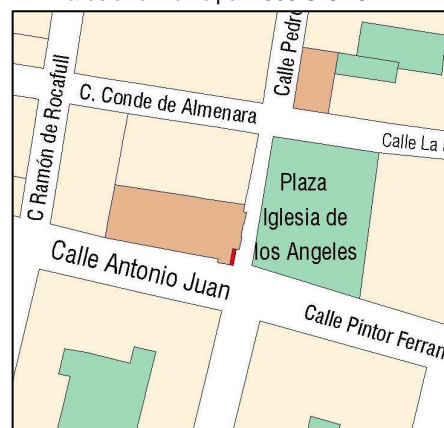
Planeamiento vigente SIGESPA

OTROS: Corrección de Errores: DOGV 03.05.1993