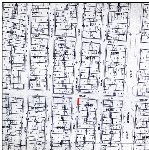
Cartográfico C.G.C.C.T 1980