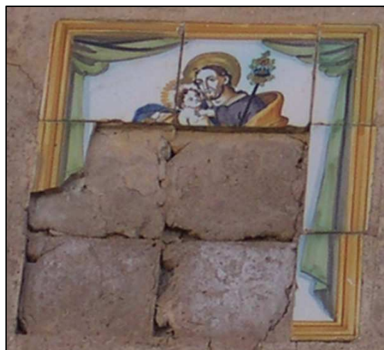
Retablo cerámico de San Jose

Cartografía Catastral: YJ2792B Manzana: 97205 Parcela: 13 CART. CATASTRAL: 423-5-IV IMPLANTACION: FORMA: SUPERFICIE: