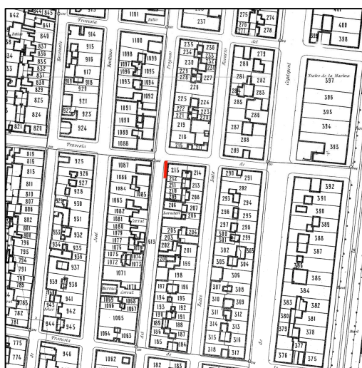
Cartográfico Municipal 1929-1945

José mantiene al Niño en el brazo derecho y la vara florida en el izquierdo, con túnica morada y manto anaranjado. "La orla tiene bocel entre doble filete amarillo y naranja; cortinas verdes plegadas a l'antique. Realizado con pintura cerámica policroma vidriada sobre fondo estannífero liso. No posee inscripciones. El retablo tiene un formato rectangular vertical, cuyas dimensiones son 0,6 x 0,5 m Tiene un total de 9 piezas; las dimensiones de cada pieza individualizada es 0,2 x 0,2 y 0,2 x 0,1 m, y no presenta fornícula." (1)