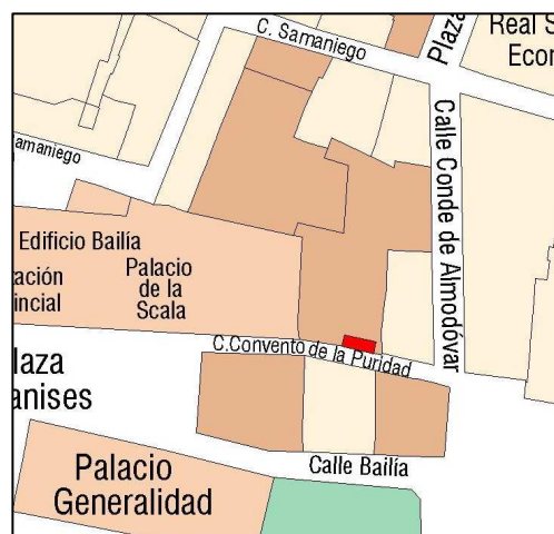
Planeamiento vigente SIGESPA

PLANEAMIENTO: PEPRI SEU-XEREA [BOP 26-02-93] HOJA PLAN GENERAL: 28 CLASE DE SUELO: SU CALIFICACION: USO: SIN USO PROTECCION ANTERIOR: OTROS: Nº Archivo: RI1277