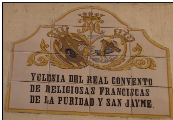
Panel Heráldico de la Puridad

Cartografía Catastral: YJ2753B Manzana: 58321 Parcela: 02 CART. CATASTRAL: 401-16-IV IMPLANTACION: FORMA: SUPERFICIE: