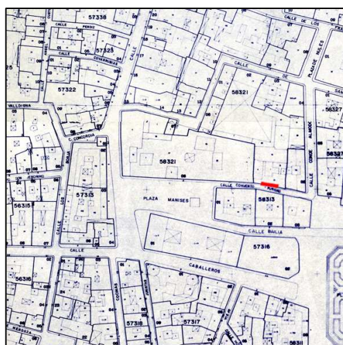
Cartográfico C.G.C.T. 1980