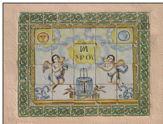
Retablo cerámico con el anagrama del Nombre de María y Símbolos de la Virgen María

Cartografía Catastral: 00YJ36C Manzana: 00210 Parcela: 03 CART. CATASTRAL: 490-21-I IMPLANTACION: FORMA: SUPERFICIE: