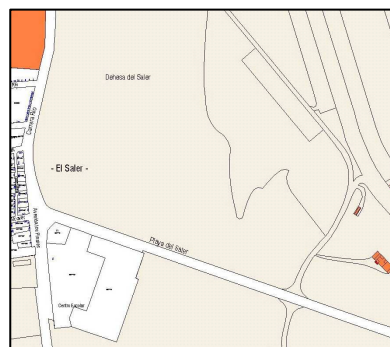
Parcelario Municipal 2009 SIGESPA

NUMERO DE EDIFICIOS: 1 NUMERO DE PLANTAS: OCUPACION: CONSERVACION: Bueno, integro. El riesgo de destrucción es alto