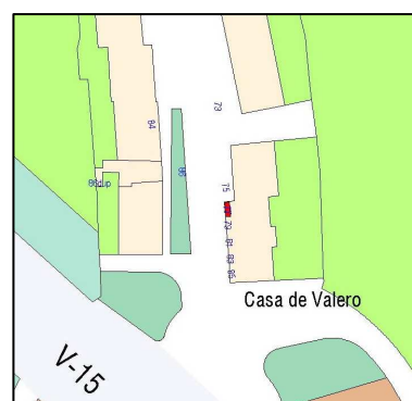
Planeamiento vigente SIGESPA

PLANEAMIENTO: HOMOLOGACIÓN Y PE "LA PUNTA" [BOP 29-11-02] HOJA PLAN GENERAL: 49 CLASE DE SUELO: SNU CALIFICACION: USO: SIN USO PROTECCION ANTERIOR: OTROS: Nº Archivo: PE1629