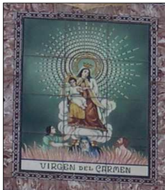
Retablo cerámico de la Virgen del Carmen

Cartografía Catastral: 00YJ27B Manzana: 00240 Parcela: 70 CART. CATASTRAL: 423-24-IV IMPLANTACION: FORMA: SUPERFICIE: