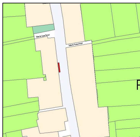
Planeamiento vigente SIGESPA

OTROS: Corrección de Errores: DOGV 03.05.1993