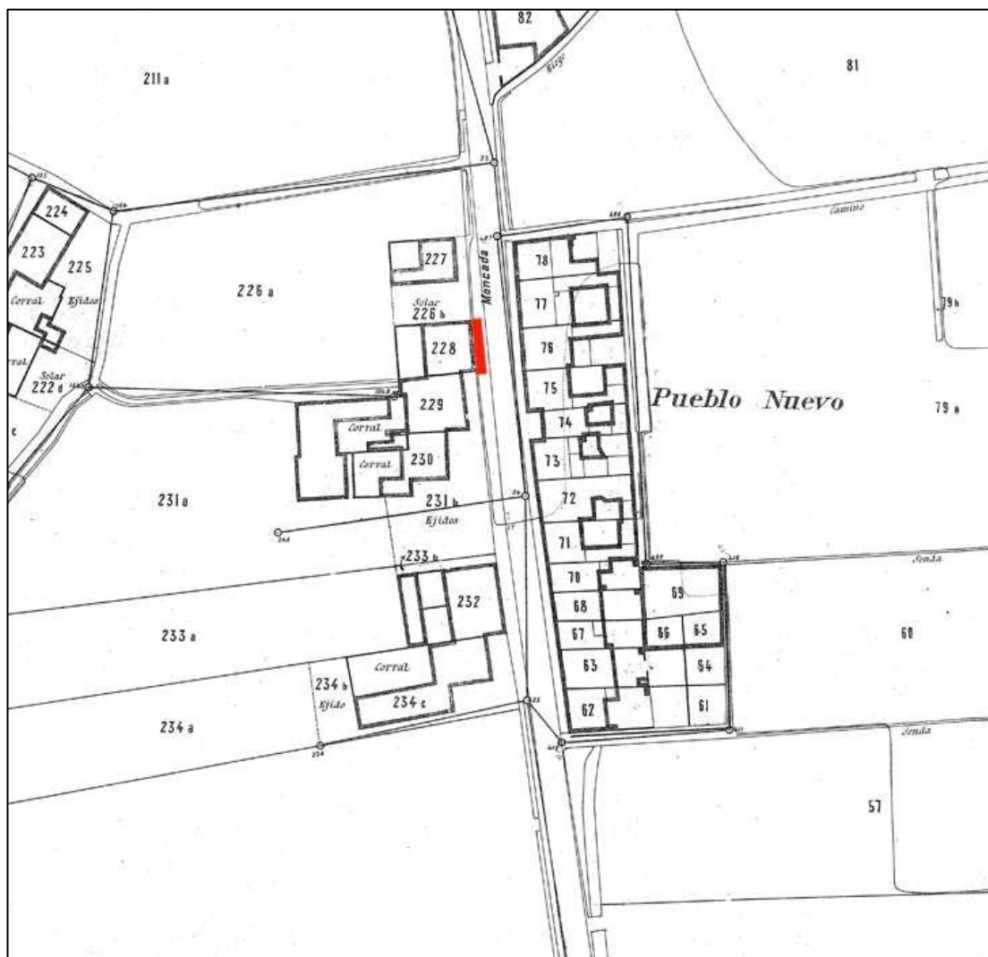
Cartográfico Municipal 1929-1945

"Sobre una nube, mantenida por dos ángeles que hacen sonar trompetas apocalípticas, Vicente con hábito dominico lleva un libro abierto en la mano izquierda y señala con el índice diestro hacia el cielo y su lema; de la cabeza sale una llama. La orla es de cintetas de serie con estrellitas azules y moldura cerámica del mismo color. Realizado con pintura cerámica polícroma vidriada sobre fondo estannífero liso. Posee inscripciones (Abajo): "SAN VICENTE FERRER" El retablo tiene un formato rectangular vertical, cuyas dimensiones son 0,8 x 0,6 m. Tiene un total de 12 piezas (a parte las piezas de serie y la moldura cerámica); las dimensiones de cada pieza individualizada es 0,2 x 0,2 m. No presenta fornicula. Hay adornos moldurados en torno al panel (arriba y en esquinas inferiores) a juego con los del resto de la fachada." (1)