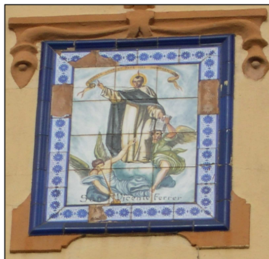
Retablo cerámico de San Vicente Ferrer