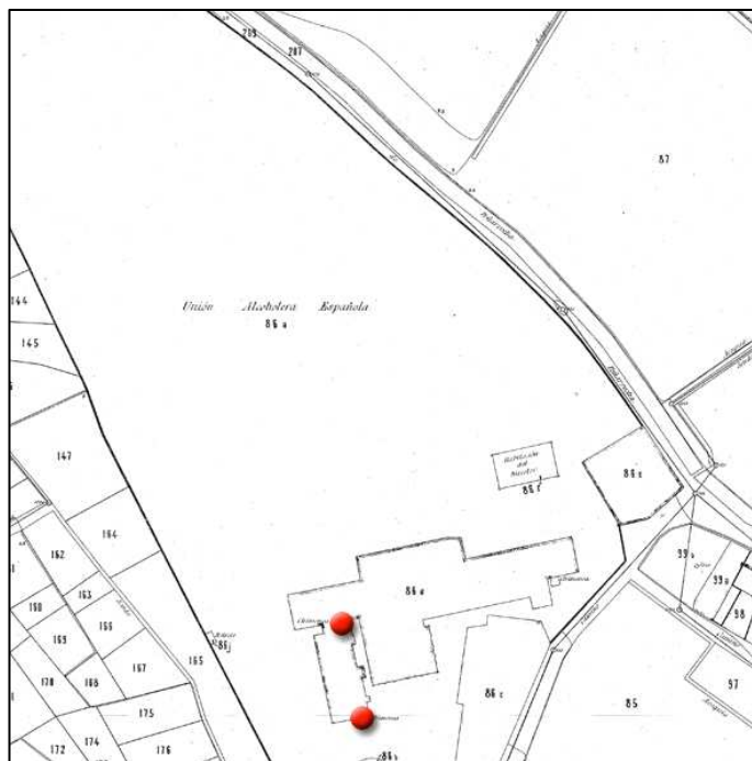
Cartográfico Municipal 1929-1945

Sus fábricas son de ladrillo cocido y consta de un basamento cuadrangular rematado por una cornisa con dentículos que marca la línea de transición con el tronco, de sección octogonal y de forma troncocónica; forma canónica de estas chimeneas para impedir la entrada de aire frío, facilitando así una corriente de aire por inversión térmica. Se remata con una corona y linterna enmarcada por dos molduras de ladrillo.