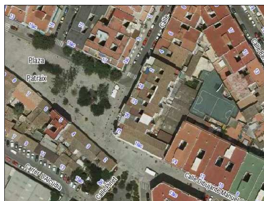
Fotografía Aérea 2008

Cartografía Catastral: YJ2741F Manzana: 45152 Parcela: 13 CART. CATASTRAL: 422-10- IV IMPLANTACIÓN: EN ESQUINA FORMA: REGULAR SUPERFICIE: 353 m2