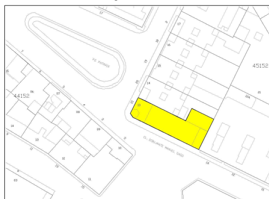
Plano catastral 2009

NÚMERO DE EDIFICIOS: 1 NÚMERO DE PLANTAS: 1 OCUPACIÓN: TOTAL CONSERVACIÓN: BUENO