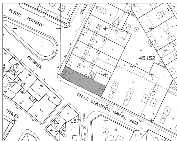
Cartográfico C.G.C.C.T 1980