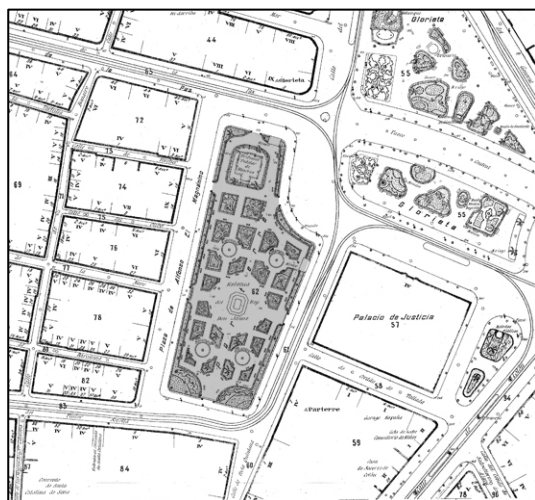
Cartográfico Municipal 1929-1945