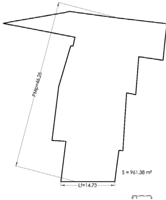
ESQUEMA EN PLANTA